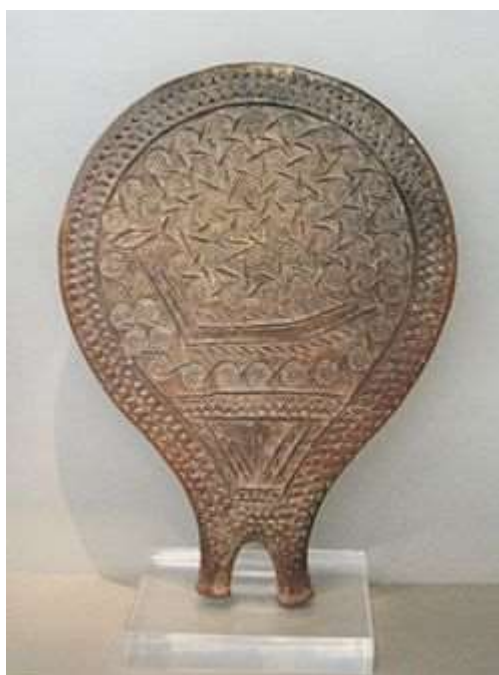
Παράσταση πλοίου σε πρωτοκυκλαδικό «τηγανόσχημο» σκεύος