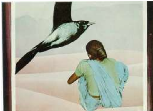
Κολάζ του Οδ .Ελύτη

Σύμφωνα με τον Π. Ανδριόπουλο, το πρώτο κολάζ αποτελεί σύνθεση τριών διαφορετικών στοιχείων: «Ένα ακατοίκητο σπίτι στη μέση της σύνθεσης, τον ολόσωμο εικονογραφικό τύπο του ιαματικού Αγίου Παντελεήμονα δεξιά, και έναν άγγελο επάνω αριστερά».