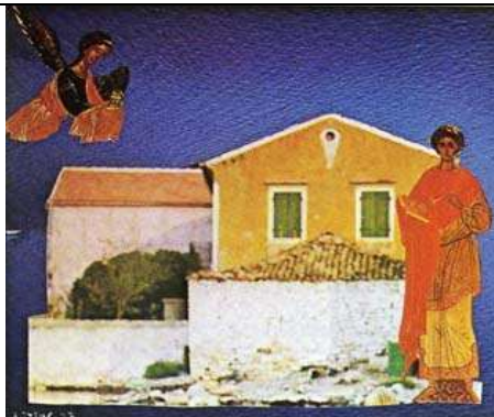
Κολάζ του Οδ .Ελύτη