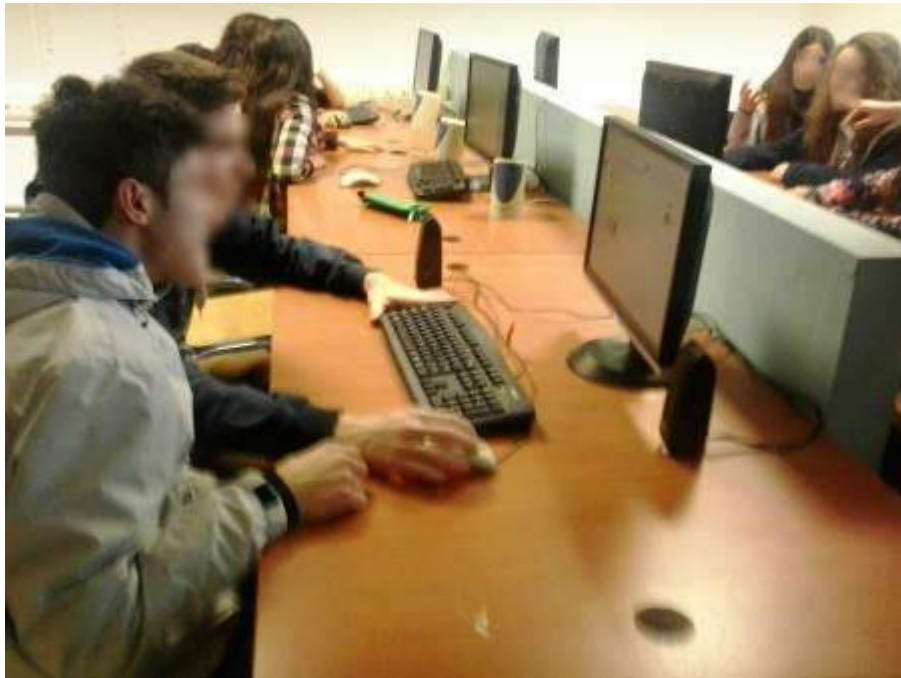
Εικόνα 4: Ενεργοποιώντας την σημασιολογία.

ΕΣΠΑ 2007-2013 πρόγραμμα για την ανάπτυξη ΕΥΡΩΠΑΪΚΟ ΚΟΙΝΩΝΙΚΟ ΤΑΜΕΙΟ