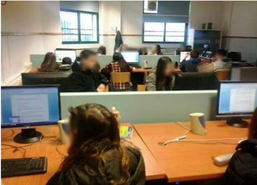
Εικόνα 2: Οι μαθητές εργάζονται σε ομάδες.

ΕΣΠΑ 2007-2013 πρόγραμμα για την ανάπτυξη ΕΥΡΩΠΑΪΚΟ ΚΟΙΝΩΝΙΚΟ ΤΑΜΕΙΟ