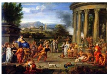
Κλέοβις και Βίτων, Nicolas Loir, 1649.