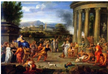
Κλέοβις και Βίτων, Nicolas Loir, 1649.

Ποιες προϋποθέσεις είναι οι απαραίτητες για να νιώθει ευτυχισμένος ένας άνθρωπος στη σύγχρονη εποχή; Νομίζετε ότι τα υλικά αγαθά είναι αρκετά για να του εξασφαλίζουν την πολυπόθητη χαρά της ζωής; Συζητήστε μεταξύ σας και γράψτε τις απόψεις σας.