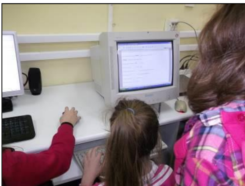
Εικ. 10: Μαθητές συμπληρώνουν τις ασκήσεις που δημιούργησαν άλλες ομάδες

Τέλος οι μαθητές αποθήκευσαν τις εργασίες τους και εμφάνισαν την προεπισκόπηση της άσκησης στο πρόγραμμα πλοήγησης ακολουθώντας την οδηγία του εκπαιδευτικού. Οι μαθητές όλων των ομάδων κινήθηκαν στους άλλους υπολογιστές προκειμένου να δοκιμάσουν τις γνώσεις τους πραγματοποιώντας ψηφιακά την άσκηση (Εικ. 10).