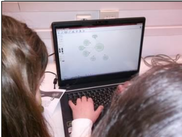
Εικ. 3 & 4: Οι μαθητές καταγράφουν τις στρατηγικές τους στον υπολογιστή και στο χαρτί.