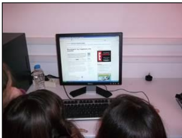
Εικ. 1: Ομάδα μαθητών διαβάσει από επιλεγμένες ιστοσελίδες

πλειοψηφία των μαθητών τέθηκε ως στόχος η επιλογή στρατηγικών διερεύνησης σημασίας των λέξεων με αφετηρία τη λέξη κυνοκομείο .