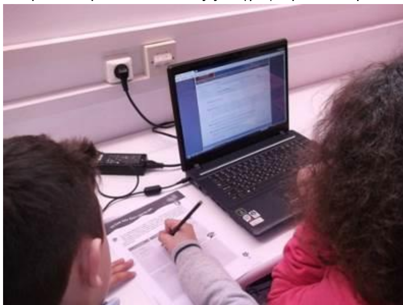
Εικ. 5: Διερεύνηση λέξεων και γραφή τους μέσα σε προτάσεις.

Στη συνέχεια και στα πλαίσια της δραστηριότητας 5 οι μαθητές επέστρεψαν στο Λεξικό της Κοινής Νεοελληνικής (Τριανταφυλλίδη) και αναζήτησαν με την καθοδήγηση του εκπαιδευτικού πληκτρολογώντας στο πεδίο αναζήτησης «%κομείο» λέξεις με το δεύτερο συνθετικό –κομείο. Κάθε ομάδα μαθητών στα πλαίσια των δραστηριοτήτων 6 και 7 ανέλαβε να γράψει τη σημασία τριών από τις 13 λέξεις του καταλόγου που εμφανίστηκε. Κατόπιν θα έπρεπε να στείλει τις λέξεις αυτές στα «Σώματα Κειμένων» και να τις ξαναγράψει μέσα σε προτάσεις (Εικ. 5).