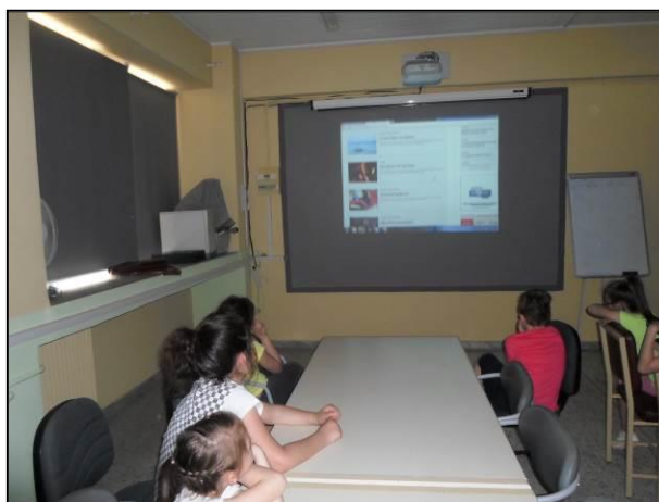
Τεκμήριο 7: Συζήτηση για τη λεζάντα

Προκειμένου οι μαθητές να επιβεβαιώσουν τις γνώσεις τους για τη λεζάντα ο εκπαιδευτικός παρουσίασε με τη βοήθεια του βιντεοπροβολέα την ιστοσελίδα http://www.topontiki.gr/category/i-lezanta και συζητήθηκε η συνάφεια συγκεκριμένων λεζαντών με τις εικόνες που περιέγραφαν (Τεκμήριο 7).