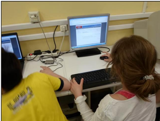
Τεκμήριο 6: Αναζητήσεις σε ψηφιακά λεξικά

Και σε αυτήν τη δραστηριότητα το γεγονός ότι οι μαθητές γνώριζαν τα ψηφιακά λεξικά της Πύλης για την Ελληνική Γλώσσα http://www.greek-language.gr/greekLang/modern_greek/tools/lexica/triantafyllides/search.html και το Βικιλεξικό http://el.wiktionary.org/wiki/ , γνώριζαν να χρησιμοποιούν τις υπερσυνδέσεις και να εργάζονται ταυτόχρονα με πολλά αρχεία τους βοήθησε να βρουν, να διαβάσουν και να ανακοινώσουν τους ορισμούς των λέξεων που ζητήθηκαν (Τεκμήριο 6).