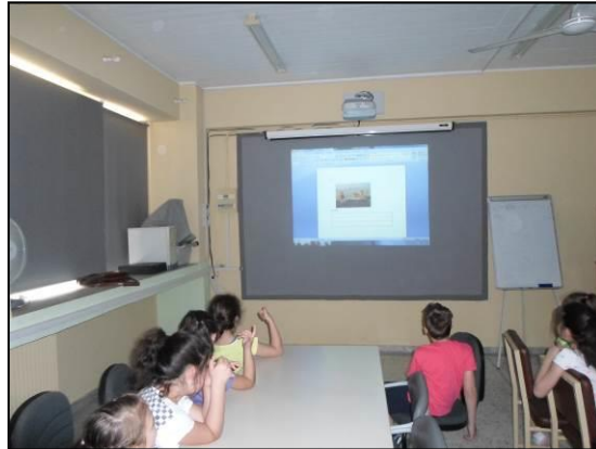
Τεκμήριο 8: Επιλογή λεζάντας

Οι λεζάντες που επιλέχθηκαν να γραφούν στα ψηφιακά φύλλα εργασίας ήταν οι εξής: