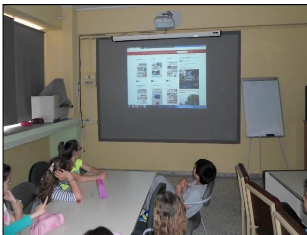
Τεκμήριο 1: Πρωτοσέλιδα ελληνικών εφημερίδων

Στο σημείο αυτό ο εκπαιδευτικός με τη βοήθεια του κεντρικού βιντεοπροβολέα παρουσίασε τον ιστότοπο με τα πρωτοσέλιδα των ελληνικών εφημερίδων στην ηλεκτρονική διεύθυνση http://www.frontpages.gr/ (Τεκμήριο 1) και κάλεσε τους μαθητές να ανακοινώσουν τι βλέπουν.