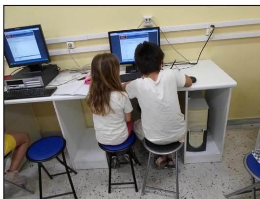
Τεκμήρια 11 & 12: Δημιουργία τετράστιχων

Κατά τη διάρκεια της εργασίας των μαθητών, ο εκπαιδευτικός καθοδηγούσε τις μαθητικές ομάδες εξηγώντας τις άγνωστες λέξεις και βοηθώντας στον τρόπο δημιουργίας του τετράστιχου. Παρόλο που ήταν μια πρώτη απόπειρα να δημιουργηθούν τετράστιχα βάσει συγκεκριμένων λέξεων, κάποιες μαθητικές ομάδες κατάφεραν να ολοκληρώσουν τις δημιουργίες τους σε συγκεκριμένο χρόνο και να τις παρουσιάσουν στην ολομέλεια.