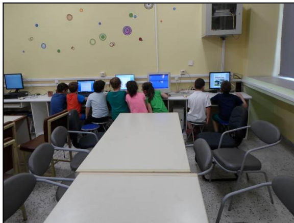
Τεκμήριο 2: Εξερεύνηση ψηφιακής εφημερίδας

Καθώς η πρώτη δραστηριότητα του φύλλου εργασίας είχε ολοκληρωθεί κατά το προηγούμενο διδακτικό δίωρο, οι μαθητές είχαν τη δυνατότητα κάνοντας χρήση της υπερσύνδεσης που οδηγεί στην ιστοσελίδα της μηνιαίας μαθητικής εφημερίδας του Δημοτικού Σχολείου Ριζού να περιηγηθούν σε αυτή και να θυμηθούν χαρακτηριστικά της εφημερίδας που είχαν συζητηθεί στην ολομέλεια ( Τεκμήριο 2 ).