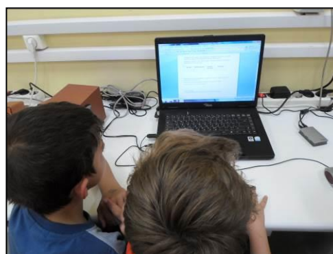
Τεκμήρια 4 & 5: Συμπλήρωση πίνακα

Στην τελευταία δραστηριότητα του φύλλου εργασίας οι μαθητές έπρεπε να εργαστούν σε τρία διαφορετικά ψηφιακά λεξικά προκειμένου να βρουν τους ορισμούς των λέξεων «εφημερίδα», «πρωτοσέλιδο», «συνέντευξη», «άρθρο». Δόθηκαν οι συγκεκριμένες λέξεις στους μαθητές επειδή είτε είχαν συζητηθεί, είτε είχαν ανακοινωθεί στην τάξη κατά την προηγούμενη εργασία των μαθητών. Διευκρινίστηκε στους μαθητές ότι θα έπρεπε να συνεργαστούν, ώστε να εντοπίσουν τυχόν μειονεκτήματα ή πλεονεκτήματα των λεξικών που θα χρησιμοποιούσαν. Επίσης, δόθηκε η οδηγία ότι η αναζήτηση στο Εικονογραφημένο Λεξικό Α', Β', Γ' Δημοτικού http://pi-schools.sch.gr/dimotiko θα γινόταν στην ολομέλεια με τη βοήθεια του κεντρικού Η/Υ, αφού επρόκειτο για ένα λεξικό που δεν είχαν χρησιμοποιήσει στο παρελθόν οι μαθητές.