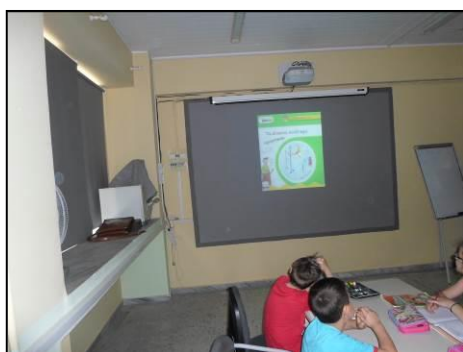
Τεκμήριο 10: Τα άτακτα ουδέτερα

Ο εκπαιδευτικός παρουσίασε με τη βοήθεια του βιντεοπροβολέα στην ολομέλεια το παιδικό τραγούδι « Τα άτακτα ουδέτερα » στην ηλεκτρονική διεύθυνση http://www.youtube.com/watch?v=Utvz4EQ5TYYY&playnext=1&list=PL17EDE5F3335F8E10 (Τεκμήριο 10).