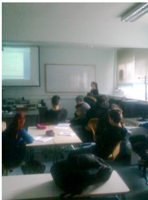
Παρουσίαση του συνεργατικού κειμένου