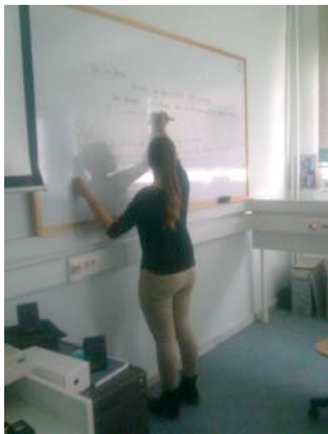
Καταγραφή των συμπερασμάτων