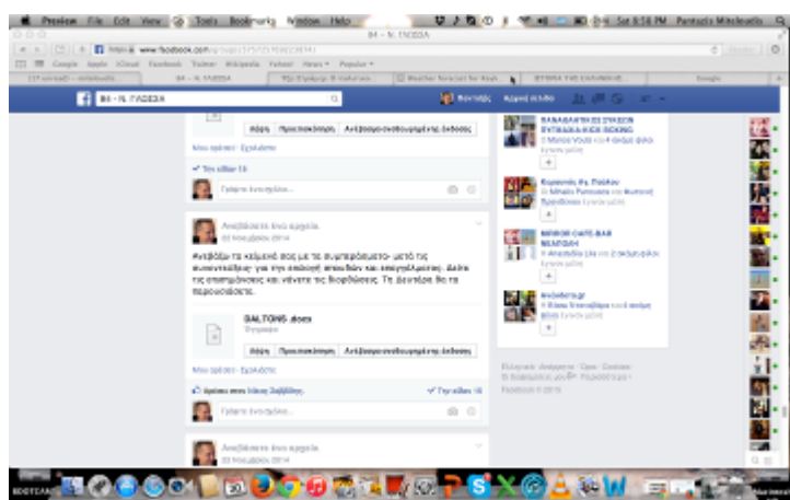
Από την ομάδα στο Facebook