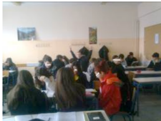
Οι μαθητές εργάζονται σε ομάδες