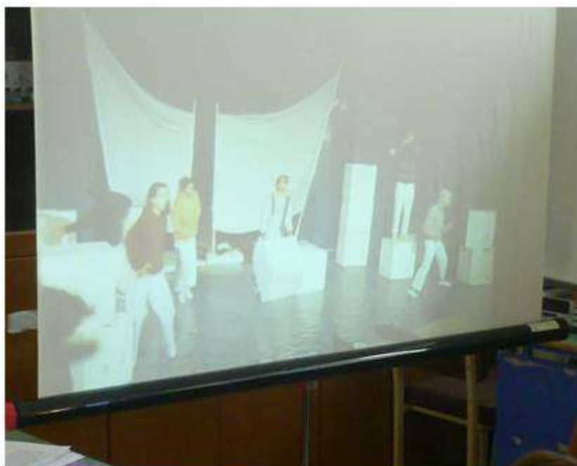
Προβολή του «Οδυσσεύς»