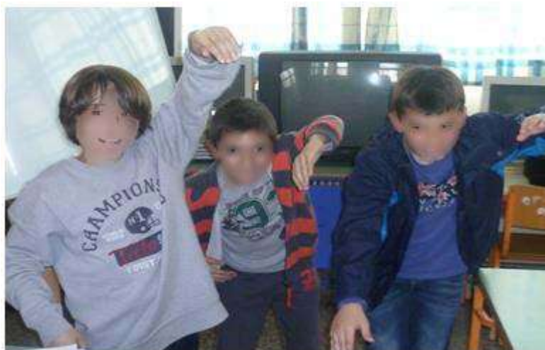
Οι μαθητές παίζουν παντομίμα