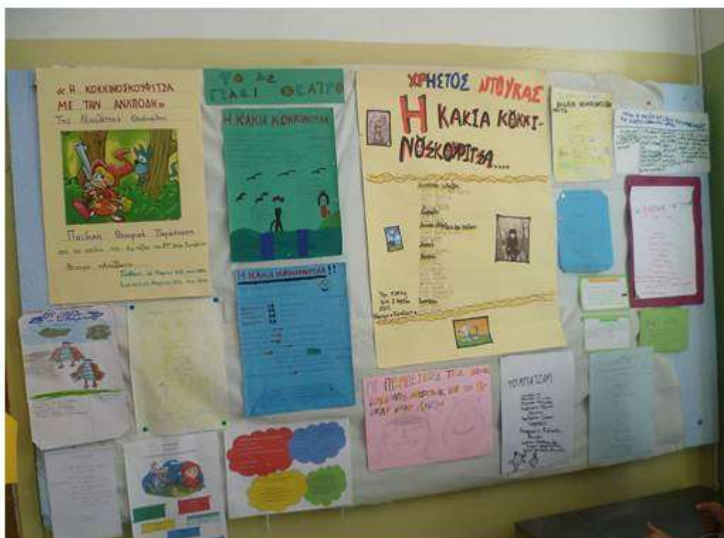
Δείγμα της δουλειάς των παιδιών που αναρτήθηκε στο ταμπλό της τάξης