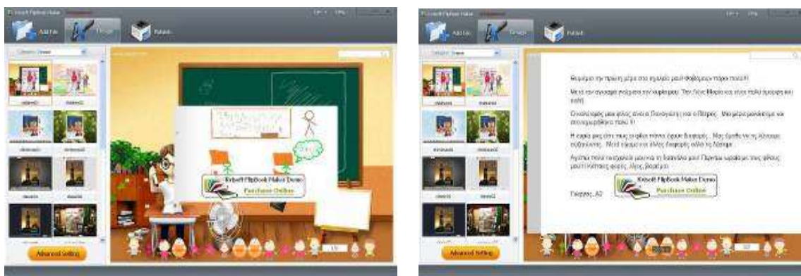
Εικόνες από το βιβλίο που έφτιαξαν οι μαθητές

Στο τέλος, η δημιουργία του βιβλίου των αναμνήσεων, που είναι αποτέλεσμα της συνεργασίας και της συλλογικής προσπάθειας όλης της τάξης, παρουσιάζεται ολοκληρωμένη στην ολομέλεια της τάξης. Οι μαθητές καλούνται από τον εκπαιδευτικό να πάρουν τον λόγο και να πουν: πώς τους φάνηκε η διαδικασία, αν τους άρεσε, πώς τους φάνηκε το βιβλίο που έφτιαξαν, αν θα ήθελαν να αλλάξουν κάτι σε αυτό (επιλογή χρωμάτων, φόντου, γραμμάτων). Με τη βοήθεια του εκπαιδευτικού γίνεται ανάρτηση του «βιβλίου των αναμνήσεων της Α΄ τάξης» στην ιστοσελίδα του σχολείου.