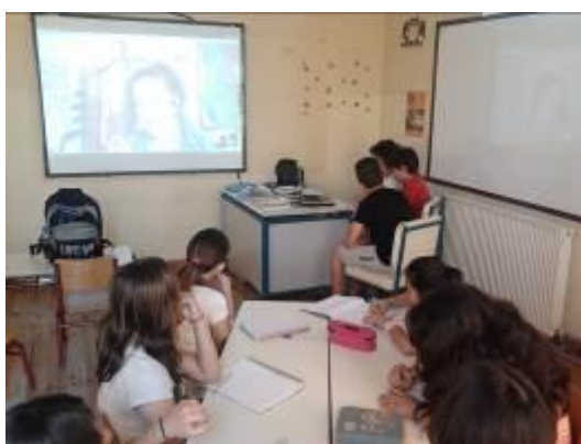
Εικόνα 6. Η συνέντευξη στο Skype