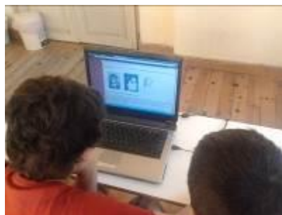
Εικόνα 1: Οι μαθητές εξερευνούν τη σελίδα atlaswikigr

Πανεπιστήμιο Θεσσαλονίκης http://atlaswikigr.wetpaint.com και στο οποίο περιλαμβάνονται εξέχουσες γυναίκες επιστήμονες. Στην ίδια ιστοσελίδα, οι μαθητές μελέτησαν τις πληροφορίες για ορισμένες επιστήμονες (βλ. εικόνα 1).