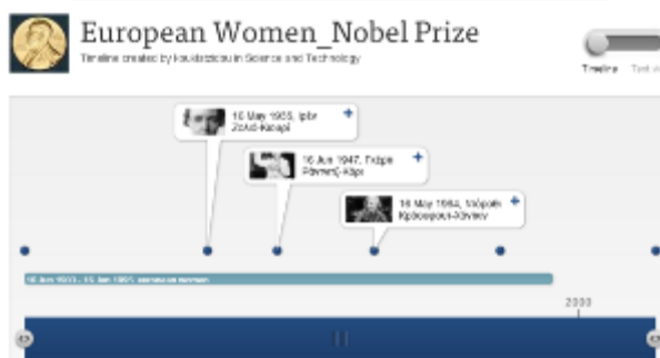
Εικόνα 4: Δημιουργία χρονογραμμής

Προκειμένου να αντιληφθούν οι μαθητές τις ιστορικο-κοινωνικές προεκτάσεις που προκύπτουν από τη χρονογραμμή που κατασκευάσαμε, έθεσα τα εξής ερωτήματα: α) υπάρχει σύνδεση μεταξύ της αύξησης απόδοσης βραβείων Νόμπελ σε γυναίκες και των εκάστοτε ιστορικών συνθηκών; β) γιατί ήταν αρχικά σπάνιο φαινόμενο; γ) από πότε άρχισε να αυξάνεται η απόδοση βραβείων Νόμπελ σε γυναίκες και για ποιους λόγους συνέβη αυτό; δ) ποια γεγονότα συνέβαλαν στην κατάλυση των στερεότυπων απέναντι στο σύγχρονο ρόλο της γυναίκας; Οι απαντήσεις που έδωσαν οι μαθητές αποκάλυψαν πως υπάρχει μεγάλη συσχέτιση μεταξύ των κοινωνικο-ιστορικών συνθηκών και της θέσης της γυναίκας στην επιστήμη και στην κοινωνία γενικότερα. Η σύνδεση αυτή που έγινε μέσα από τη συζήτηση που προκλήθηκε βοήθησε τους μαθητές να σταθούν πιο κριτικά απέναντι σε ζητήματα φύλου αλλά και να διαπιστώσουν τους εγκιβωτισμένους συσχετισμούς μέσα στο ιστορικο-κοινωνικό πλέγμα.