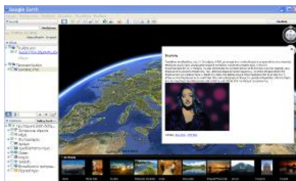
Εικόνα 3: Αποτύπωση πληροφοριών επιλεγμένων επιστημόνων στον χάρτη

δημιουργήσαμε και την αποθήκευσή του ως έργο στον προσωπικό φάκελο του κάθε μαθητή προκειμένου να αποτελέσει δείγμα της εργασίας στο e-portfolio.