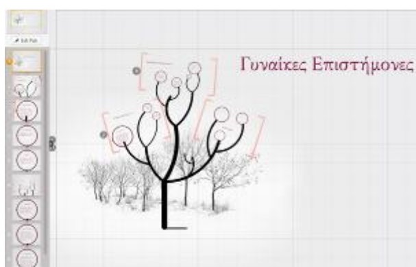
Εικόνα 5: Δημιουργία παρουσίασης στο Prezi

επικεντρώνεται στη συμβολή των γυναικών επιστημόνων στην εξέλιξη της επιστήμης. Για να το επιτύχουμε αυτό, χρησιμοποιήσαμε το web 2.0 εργαλείο prezī, το οποίο διατίθεται ελεύθερα στην ιστοσελίδα ( http://prezi.com/your/ ). Η χρήση αυτού του εργαλείου μάς επέτρεψε να δημιουργήσουμε μία παρουσίαση η οποία επεξεργάστηκε από όλους τους μαθητές και περιελάμβανε τις πληροφορίες που συνέλεξαν όλες οι ομάδες.