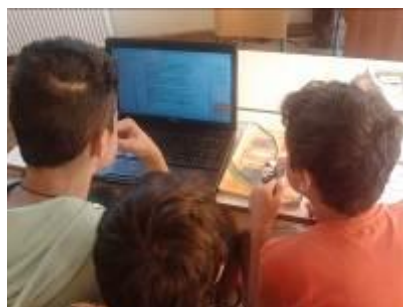
Εικόνα 2: Οι ομάδες των μαθητών επεξεργάζονται το ίδιο έγγραφο

Οι ομάδες αποφάσισαν από κοινού για ποιες γυναίκες επιστήμονες θέλουν να γράψουν το αντιπροσωπευτικό πολυτροπικό τους κείμενο. Όλες οι πληροφορίες συγκεντρώθηκαν σε ένα Google έγγραφο (βλ. εικόνα 2), το οποίο επεξεργαζόταν ταυτόχρονα από όλες τις ομάδες.