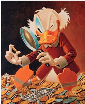
Σκρουτζ Μακ Ντακ, ο φιλάργυρος κροίσος της Λιμνούπολης.