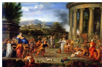
Κλέοβις και Βίτων, Nicolas Loir, 1649.