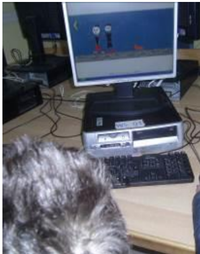
Εικόνα 6: Ζωγραφίζοντας στο εργαστήριο

Το τρίωρο αυτό οι ομάδες κλήθηκαν να αποδώσουν με ζωγραφιά την ιστορία που γράψανε και να συντάξουν ένα σύντομο φανταστικό βιογραφικό τους σημείωμα (αρχείο: Έργα παιδιών). Δόθηκε το 3 ο Φύλλο Εργασίας, κοινό για όλες τις ομάδες.