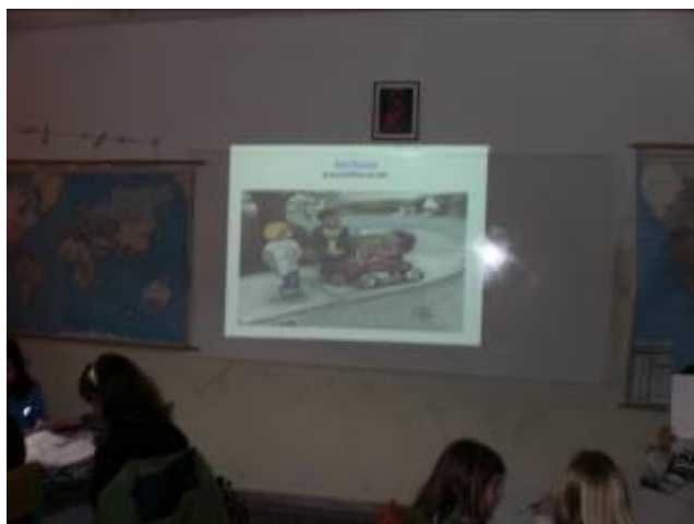
Εικόνα 3 Παρουσίαση έργων ζωγραφικής

«Ένα Σάββατο 3 φίλοι συναντήθηκαν για να παίξουν στην αγαπημένοι τους γωνία. Πήραν και ένα παλιό καροτσάκι με το οποίο έκαναν βόλτα το κορίτσι της παρέας. Μαζί τους είχαν και ένα σκυλί. Όπως έκαναν βόλτα με το καροτσάκι συνάντησαν μια κατηφόρα και έπεσαν.