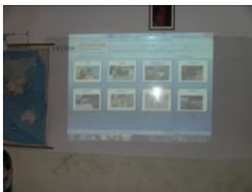
Εικόνα 7: Τοποθέτηση πινάκων

Τα παιδιά προσπάθησαν να βάλουν σε μια σειρά έκθεσης τους πίνακες των ζωγράφων αιτιολογώντας την άποψή τους. Το κριτήριο που χρησιμοποίησαν για την παραπάνω δραστηριότητα ήταν το περιεχόμενο των πινάκων. Συγκεκριμένα έβαλαν πρώτα αυτούς που απεικόνιζαν παιδιά και μετά αυτούς που παρουσίαζαν δραστηριότητες ενηλίκων φίλων. Κατόπιν κλήθηκε η κάθε ομάδα να εκφράσει με τα σώματά της κάποια εικόνα σχετική με τη φίλια. π.χ. «αγκαλιασμένοι φίλοι».