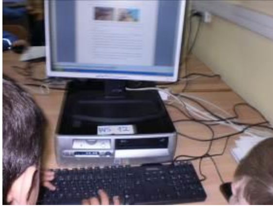
Εικόνα 5: Συμπλήρωση 2ου φύλλου εργασίας