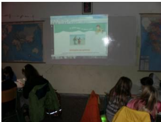
Εικόνα 1: Σχολιασμός εικόνας

Σ.: Βοήθησε, γιατί χωρίς αυτόν μπορεί να νομίζαμε ότι πρόκειται για δύο εχθρούς.