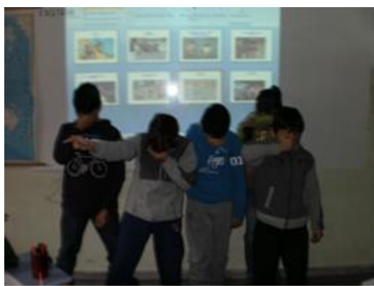
Εικόνα 8: Στατική εικόνα του πίνακα του Ernst