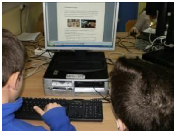
Εικόνα 4: Συμπλήρωση 1ου Φύλλου Εργασίας

Το δίωρο αυτό τα παιδιά χωρισμένα σε 4 ομάδες συμπλήρωσαν το 1 ο Φύλλο εργασίας (αρχείο: Φύλλα Εργασίας). Σε κάθε ομάδα δόθηκαν δύο πίνακες, τους οποίους θα επεξεργάστηκαν με κατάλληλες ερωτήσεις. Στόχοι αυτής της δραστηριότητας ήταν να διατυπώσουν οι μαθητές/-τριες απόψεις σχετικά με το θέμα του πίνακα, την τεχνοτροπία του (χρώματα, γραμμές, φανταστικό τοπίο ή πραγματικό, κίνηση, χρόνος), να εκφράσουν τα συναισθήματα που τους προκαλούν τα έργα, να επιχειρηματολογήσουν για τα μηνύματα που ήθελε να μεταφέρει ο/η καλλιτέχνης και να βάλουν τίτλο σε αυτά.