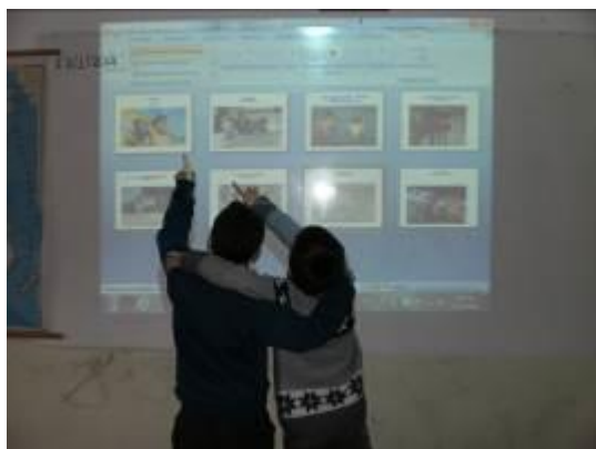
Εικόνα 9: Στατική εικόνα του πρώτου πίνακα