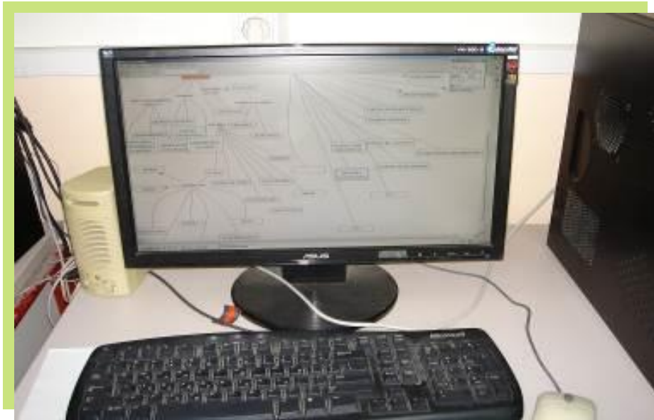
Εικόνα 1: Στιγμιότυπο από τη συμπλήρωση του εννοιολογικού χάρτη

ΕΣΠΑ 2007-2013 πρόγραμμα για την ανάπτυξη ΕΥΡΩΠΑΪΚΟ ΚΟΙΝΩΝΙΚΟ ΤΑΜΕΙΟ