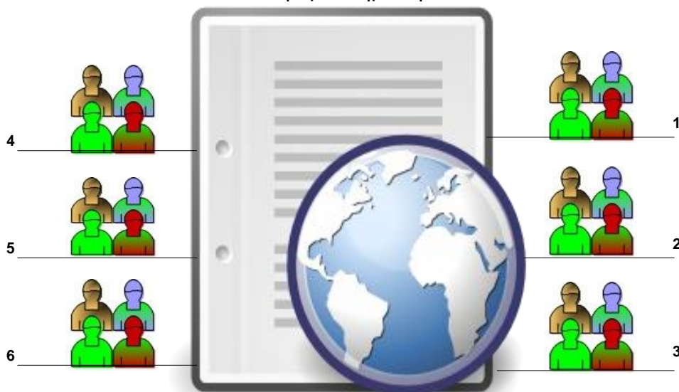
Εικόνα 1: Σχήμα συνεργασίας ομάδων