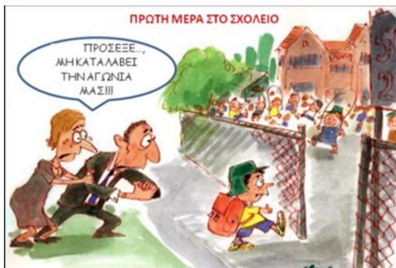
Εικόνα 3