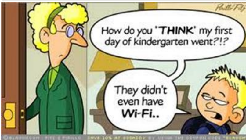
Εικόνα 4