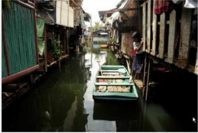
Εικόνα 4. Πρώτη μέρα σε σχολεία του κόσμου