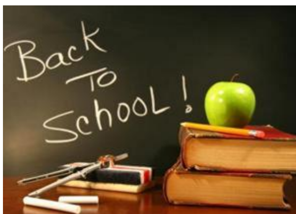
Εικόνα 2