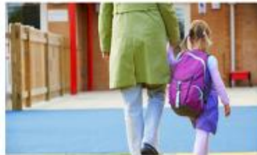
Εικόνα 6. Η δική μου πρώτη μέρα

Όταν φτάσαμε εκεί, άρχισα να αγχώνομαι και να έχω αμφιβολίες για το αν είναι καλή η δασκάλα και άμα το δημοτικό, διαφέρει πολύ από το νηπιαγωγείο... Μετά από λίγο, ένας κύριος φώναζε από το μικρόφωνο: