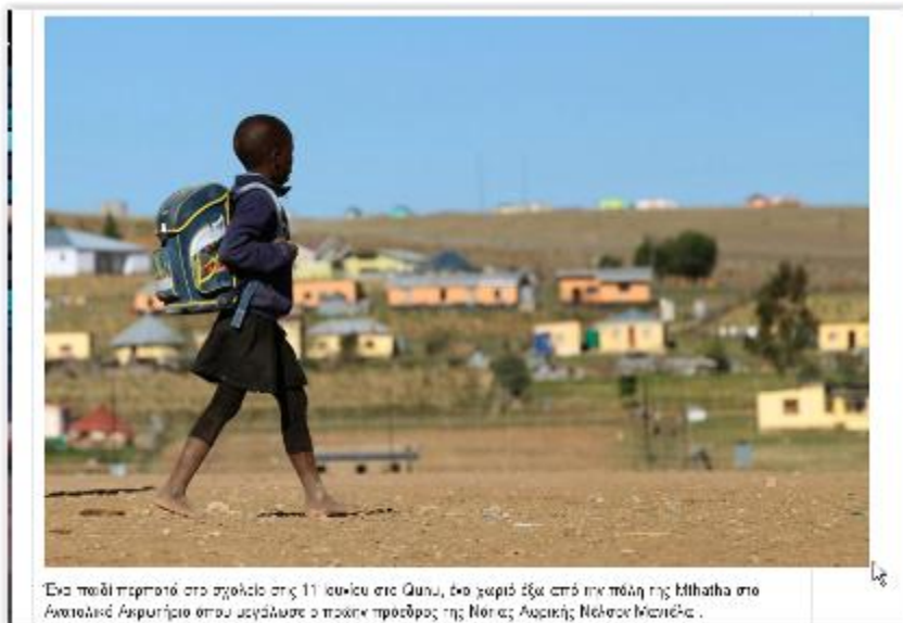
Ένα παιδί περπατά στο σχολείο στις 11 Ιουνίου στο Qunu, ένα χωριό έξω από την πόλη της Mthatha στο Ανατολικό Αφρική που μεγάλωσε ο πατέρας προέδρος της Νότιας Αφρικής Νέλσον Μαντέλα.