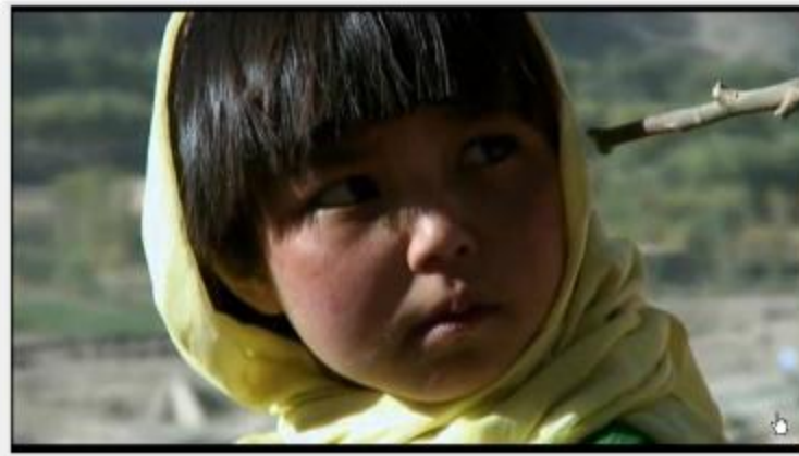
Εικόνα 3. Ο βούδας λιποθύμησε από την ντροπή