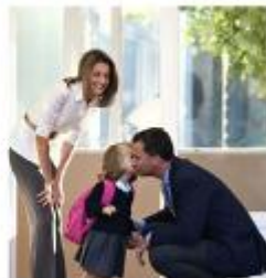
Εικόνα 7. Η δική μου πρώτη μέρα

Έτσι όλα αφήσαμε το χέρι της μαμάς και τρέξαμε εκεί που μας είπαν. Όλα τα μεγάλα παιδιά φαίνονταν σαν γίγαντες μπροστά μας.