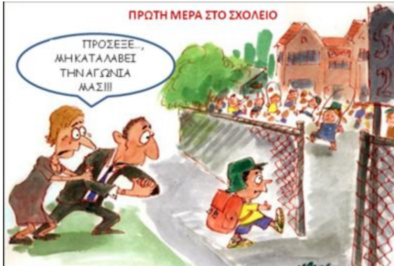
Εικόνα 3

ΕΣΠΑ 2007-2013 πρόγραμμα για την ανάπτυξη ΕΥΡΩΠΑΪΚΟ ΚΟΙΝΩΝΙΚΟ ΤΑΜΕΙΟ