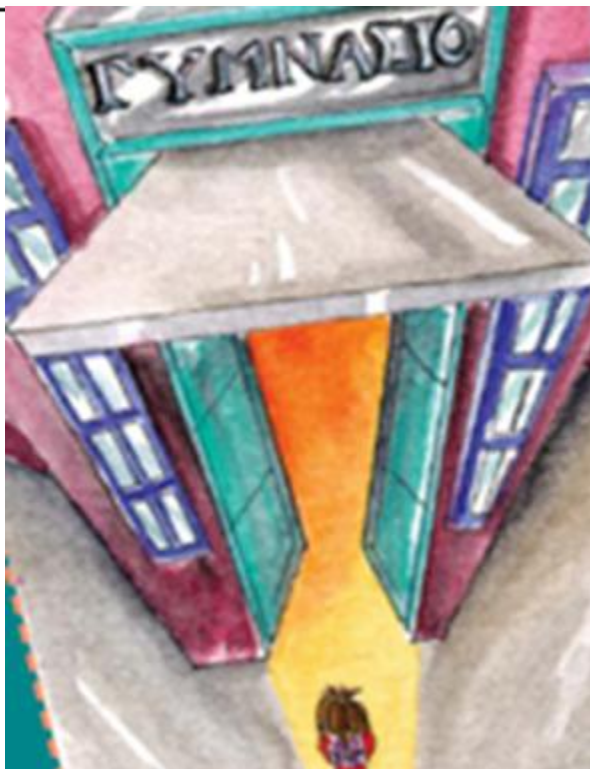
Εικόνα 1 (σχολικό βιβλίο Νεοελληνικής Γλώσσας Α΄ Γυμνασίου, ενότητα 1 )