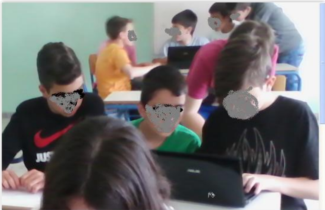
Εικόνα 6. ομάδες με φορητούς.