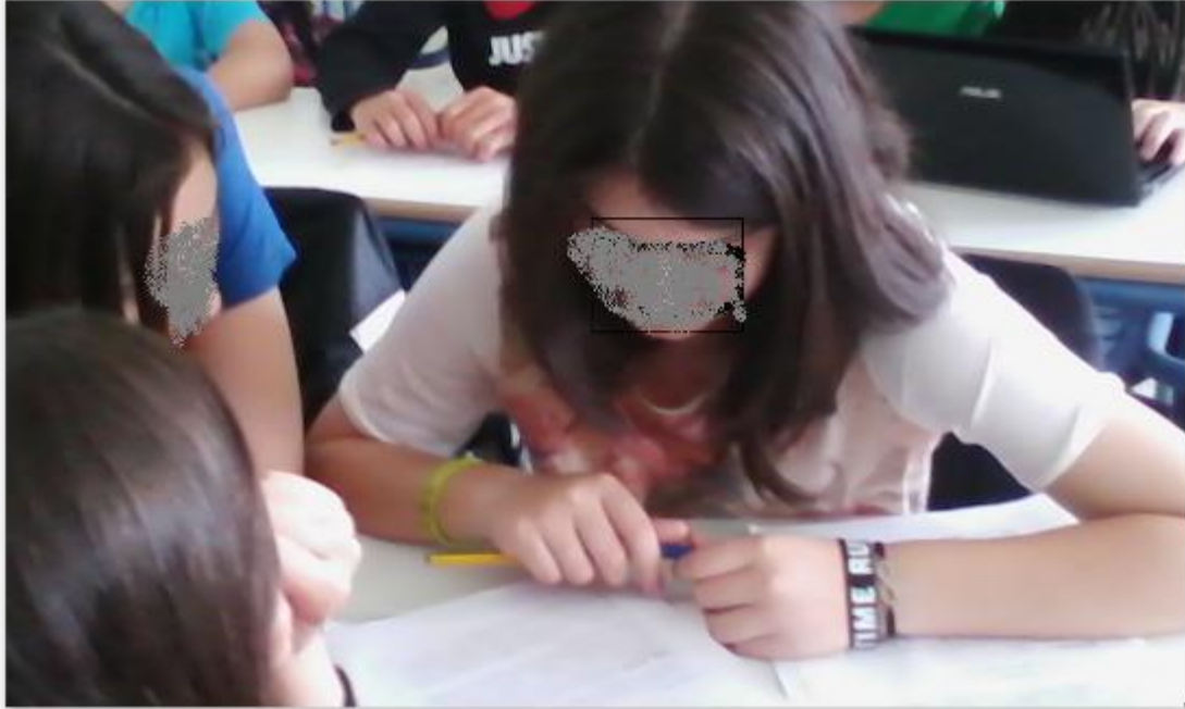
Εικόνα 7.ομάδα χωρίς φορητούς