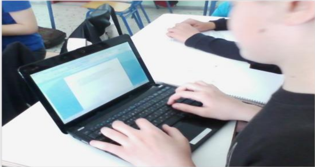
Εικόνα 5. φορητοί υπολογιστές στην τάξη

ΕΣΠΑ 2007-2013 πρόγραμμα για την ανάπτυξη ΕΥΡΩΠΑΪΚΟ ΚΟΙΝΩΝΙΚΟ ΤΑΜΕΙΟ