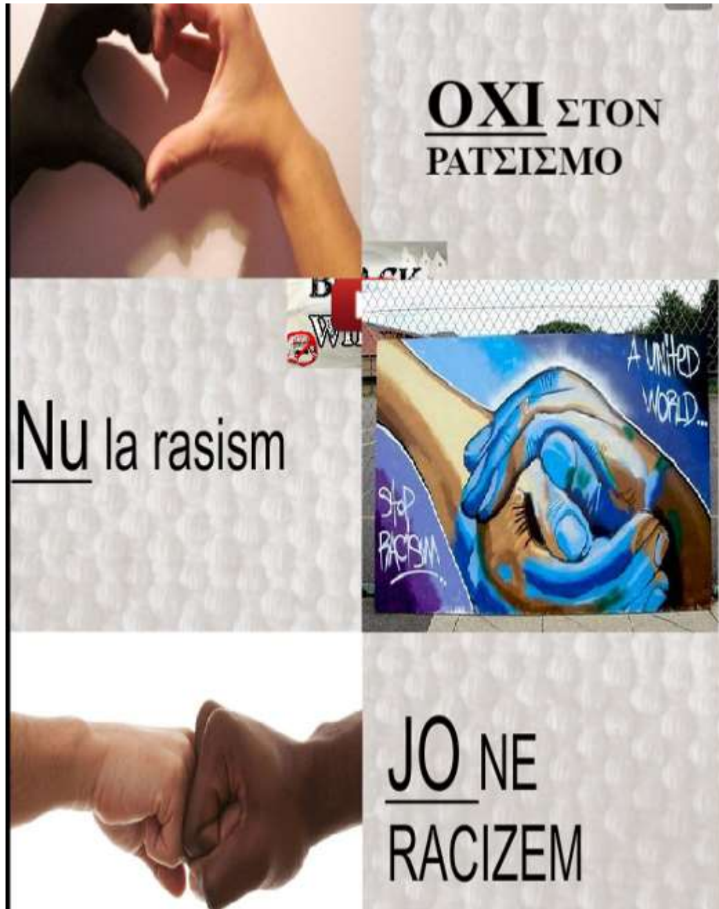
Εικόνα 23 - ομάδα 7

ΕΣΠΑ 2007-2013 πρόγραμμα για την ανάπτυξη ΕΥΡΩΠΑΪΚΟ ΚΟΙΝΩΝΙΚΟ ΤΑΜΕΙΟ