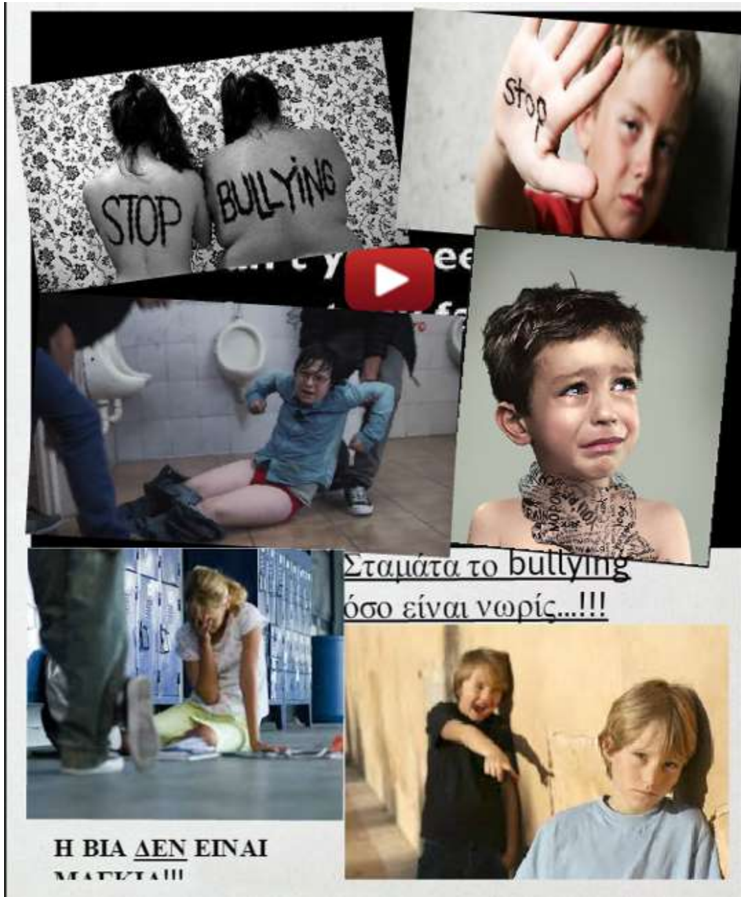
Εικόνα 21 - ομάδα 5

ΕΣΠΑ 2007-2013 πρόγραμμα για την ανάπτυξη ΕΥΡΩΠΑΪΚΟ ΚΟΙΝΩΝΙΚΟ ΤΑΜΕΙΟ