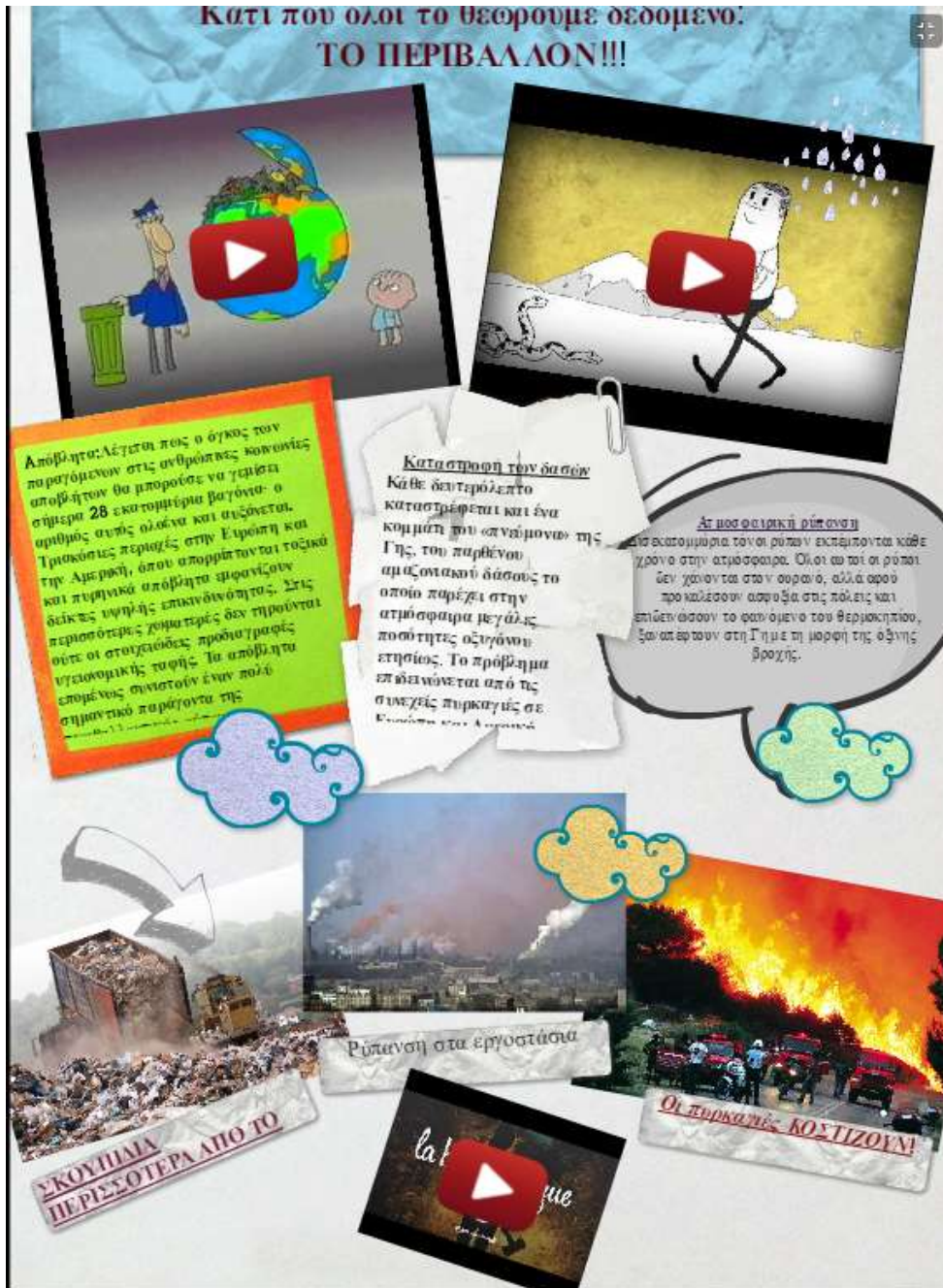
Εικόνα 17 – ομάδα 1