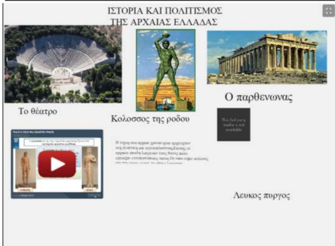
Εικόνα 19- ομάδα 3