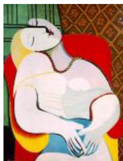
Το «Ὅνειρο» του Πικάσο, 1932

ν' άκοῦς νὰ τραγουδᾶνε χίλια ναι ἀπ' τὸ λαρύγγι τοῦ ὄχι. Ὅνειρο σημαίνει νὰ μὴν ὑπάρχουν σύνορα κι οἱ βλοσυροὶ καχύποπτοι φρουροὶ τους. Ἐλεύθερα νὰ μπαίνεις σ' ἄνθρωπο κι οὔτε τις εἶ, οὔτε τις οἶδε. Δὲν ἦρθε κι ἓνα ἀπόγευμα ποὺ νὰ μὴ γίνει βράδυ, νὰ ἔρθει κι ἓνα ὄνειρο ποὺ νὰ μὴν γίνει ἄνθρωπος, νὰ ἔρθει κι ἓνας ἄνθρωπος ποὺ νὰ μὴ γίνει ὄνειρο, τις οἶδε, τις εἶ. Ἐανοίχτηκα πολὺ σὲ ὀρισμοὺς κι εἶν' ἐπικίνδυνο νὰ κλαῖς χωρὶς πυξίδα. Φύλαγέ μου, Θέ μου, τουλάχιστον ὅσα ἔχουν πεθάνει.