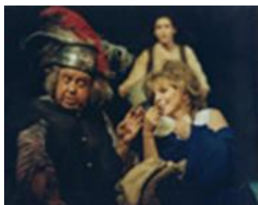
Από την παράσταση του Εθνικού Θεάτρου

Γράφουμε μία παράγραφο που θα αναφέρεται στη χρήση της ειρωνείας ως χαρακτηριστικό της σάτιρας του Ι. Καμπανέλλη.