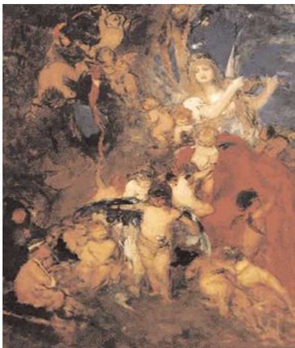
Νικολάου Γύζη, Η Τέχνη και τα πνεύματά της