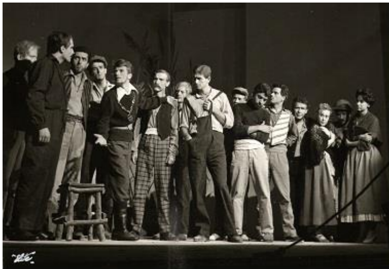
ΤΟ ΠΑΡΑΜΥΘΙ ΧΩΡΙΣ ΟΝΟΜΑ (1959)

Θίασος Βασίλη Διαμαντόπουλου, Μαρίας Αλκαίου - Νέο Θέατρο