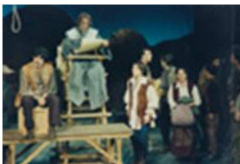
Από την παράσταση του Εθνικού Θεάτρου

Χαρακτηριστικά στοιχεία του ήθους τους μπορούμε να βιώσουμε στην καθημερινότητά μας; Αν ναι σε ποιες σκέψεις οδηγούμαστε για τη σύγχρονη ιστορική-πολιτική συγκυρία, λαμβάνοντας υπόψη ότι το έργο του Ι. Καμπανέλλη εκδόθηκε το 1959; Γράφουμε ένα άρθρο (150 λέξεις) με θέμα: Οι γυναικείοι χαρακτήρες στο Παραμύθι χωρίς όνομα του Ι. Καμπανέλλη.