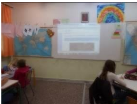
Εικόνα 3: Εμφύλιες διαμάχες–βιβλίο Ιστορίας

Επειδή δεν υπήρχε προβολικός πίνακας στο εργαστήριο Πληροφορικής του σχολείου, ο οποίος αποτελεί απαραίτητη προϋπόθεση για την εφαρμογή του σεναρίου σύμφωνα με τον συντάκτη του, οι μαθητές/-τριες χωρίστηκαν στην τάξη σε 4 ομάδες και με τη βοήθεια του προτζέκτορα παρουσιάστηκε το 1 ο Φύλλο Εργασίας . Ζητήθηκε από τις ομάδες να κρατήσουν σημειώσεις τις οποίες, αργότερα, αντέγραψαν στο εργαστήριο Πληροφορικής (αρχείο: Φύλλα Εργασίας). Από το Φύλλο αυτό πραγματοποιήθηκαν η 1 η και 3 η δραστηριότητα, δεδομένου ότι η 2 η ζητάει από τους/τις μαθητές/τριες να διαβάσουν το εθνικό ύμνο, διαδικασία που την είχαμε κάνει το προηγούμενο δίωρο, η 4 η παραπέμπει σε λεξικό για άγνωστες λέξεις τις οποίες δε συναντήσαμε ακόμα και η 5 η προϋποθέτει την εργασία στο εργαστήριο. Στην πρώτη δραστηριότητα διαβάσαμε τις στροφές (144-145) του Ύμνου, που αναφέρονται στη διχόνοια και το σχετικό κεφάλαιο του βιβλίου της Ιστορίας της Στ' Τάξης ( Κεφάλαιο 11, «Ο Ιμπραήμ στην Πελοπόννησο – Ο Παπαφλέσσας», σ. 116 ), όπου γίνεται λόγος για τις εμφύλιες διαμάχες της Επανάστασης. Τα παιδιά σχολίασαν τις δύο στροφές και η κάθε ομάδα κατέγραψε την άποψή της.