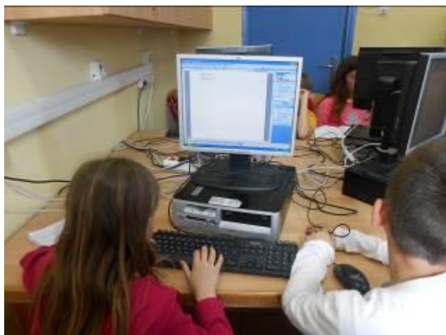
Εικόνα 8: Εργασία στο εργαστήριο

Οι ομάδες μεταφέρθηκαν στο εργαστήριο όπου αντέγραψαν τις απαντήσεις τους στα δοσμένα τροποποιημένα Φύλλα Εργασίας (αρχείο: Φύλλα Εργασίας).