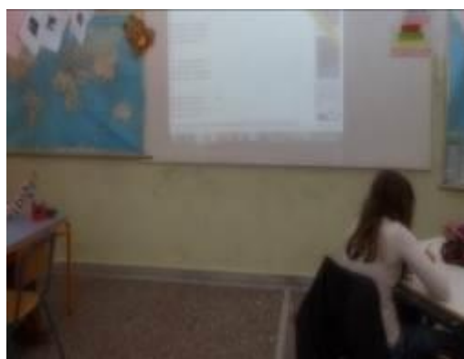
Εικόνα 2: Προβολή εθνικού ύμνου