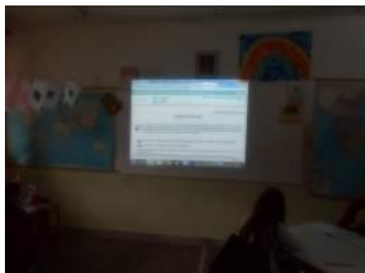
Εικόνα 1: Ανάγνωση κειμένου

τις στροφές του εθνικού ύμνου. Αξίζει να επισημανθεί ότι κάποια στιγμή τους κούρασε αυτή η δραστηριότητα, εξαιτίας των δύσκολων νοημάτων και κάποιων λέξεων του ύμνου. Για το λόγο αυτό η συγκεκριμένη διαδικασία δε συνεχίστηκε στις επόμενες διδακτικές ώρες και επιπλέον, αποτέλεσε και ένα από τα κριτήρια επιλογής δραστηριοτήτων του σεναρίου. (Στο πεδίο της κριτικής αλλά και στην παρουσίαση των διδακτικών ωρών αναφέρονται οι λόγοι για τους οποίους η εκπαιδευτικός που εφάρμοσε το σενάριο επέλεξε κάποιες δραστηριότητες αυτού).