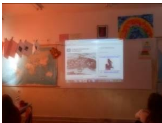
Εικόνα 5: Πρώτη πολιορκία Μεσολογγίου

Από το 4 ο Φύλλο Εργασίας , πραγματοποιήθηκαν οι τρεις πρώτες δραστηριότητες που αναφέρονται στην πρώτη πολιορκία του Μεσολογγίου (αρχείο: «Φύλλα Εργασίας»). Η 4 η και η 5 η εξαιρέθηκαν γιατί εξετάζουν το θέμα της αγριότητας των Ελλήνων το οποίο είναι αυτονόητο ότι υπάρχει σε έναν πόλεμο. Επιπλέον, θεωρήθηκε ότι η εκτενής και αρκετά απαιτητική ως προς το γνωστικό επίπεδο ομιλία του Λιαντίνη που προτείνει ο συγγραφέας, δεν θα γινόταν κατανοητή σε αυτή την ηλικία.