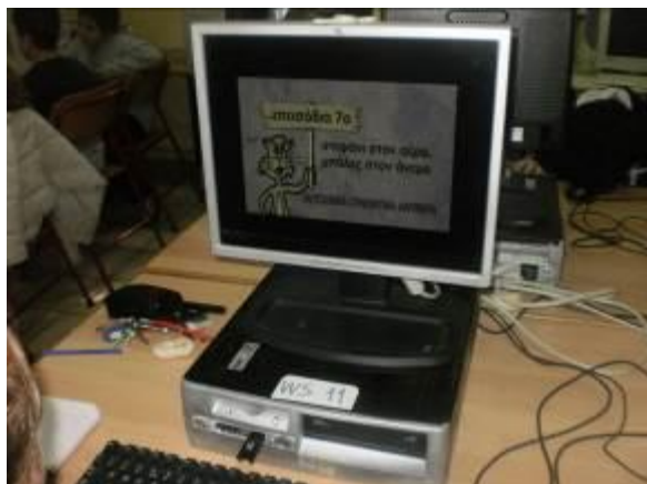
Εικόνα 4: Παρακολούθηση βίντεο

προηγούμενες ενότητες. Στη συνέχεια επισκέφθηκαν τις ιστοσελίδες με ηλεκτρονικές ασκήσεις, όπου τους ζητείται να αντιστοιχίσουν τα συνώνυμα και τα αντώνυμα και αξιολόγησαν τις γνώσεις τους (εικόνα 5).