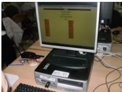
Εικόνα 5: Αντιστοίχιση λέξεων

Κατόπιν επισκέφθηκαν το Βικιλεξικό όπου τους ζητήθηκε να πληκτρολογήσουν τις λέξεις «συνώνυμο» και «αντώνυμο» και να γράψουν σε φύλλο χαρτιού τις εκδοχές για την ετυμολογία των συγκεκριμένων λέξεων. Επιπλέον, παρατήρησαν και διάβασαν την κλίση των επιθέτων συνώνυμος/-η/-ο και αντώνυμος/-η/-ο (εικόνα 6).