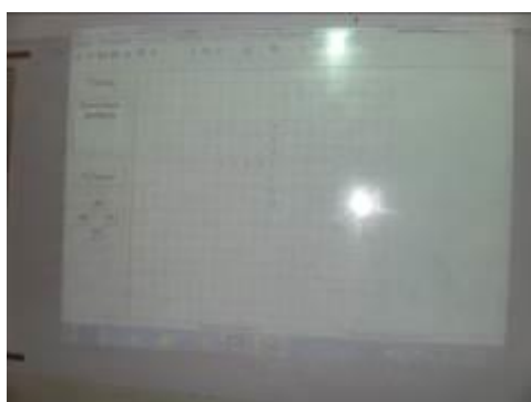
Εικόνα 10: Παρουσίαση σταυρόλεξου στο άλλο τμήμα της ΣΤ'