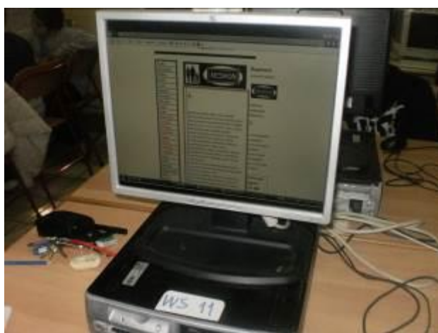
Εικόνα 7: Επιλογή λέξεων από το λεξικό

Στη συνέχεια η εκπαιδευτικός οδήγησε τα παιδιά στις δύο ιστοσελίδες, που είναι η μία λεξικό για τα συνώνυμα και η άλλη λεξικό για τα αντώνυμα . Αφού πλοηγήθηκαν σε όλες τις λέξεις κλήθηκαν να καταγράψουν όποιες λέξεις ήθελαν για να δημιουργήσουν ένα ηλεκτρονικό σταυρόλεξο και για τις δύο περιπτώσεις. Οι λέξεις που τα παιδιά επέλεξαν ήταν: αγορά, βέβαιος, γιαλός, διένεξη, αδέξιος, αθάνατος, γενναίος, δικαίωμα, μάχη. Από αυτές κάποιες χρησιμοποιήθηκαν ως συνώνυμες και κάποιες ως αντίθετες (εικόνα 7).