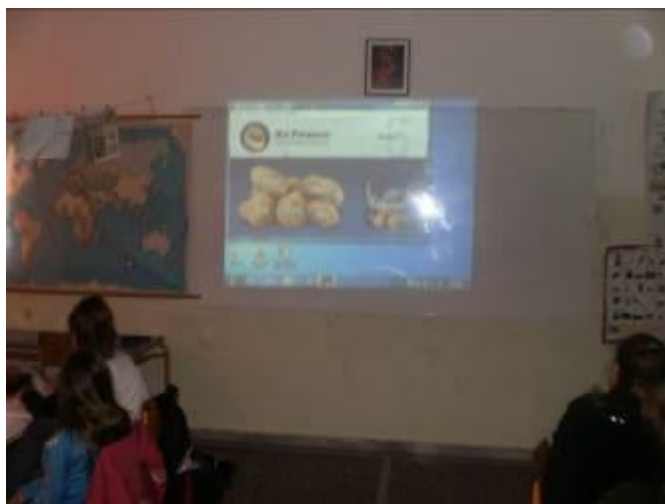
Εικόνα 9: Άνοιγμα λογισμικού