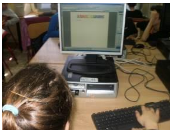
Εικόνα 3: Γράψιμο κειμένου

Στην επόμενη δραστηριότητα οι ομάδες παρακολούθησαν το βίντεο για να κατανοήσουν καλύτερα τη χρήση των συνώνυμων, των αντίθετων και των ταυτόσημων λέξεων (εικόνα 4). Εδώ επισημαίνεται ότι η σημασία και η διαφορά τους ήταν γνωστή στην πλειοψηφία των μαθητών/τριών από τη διδασκαλία τους σε