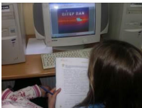
Εικόνα 2: Γράψιμο κειμένου

παρόμοια με αυτή του σεναρίου έχοντας, βέβαια, διαφορετικό το θέμα του κειμένου το οποίο καλούνται τα παιδιά να γράψουν (εικόνες 2 & 3, αρχεία: κείμενο 1ης ομάδας, κείμενο 2ης ομάδας, κείμενο 3ης ομάδας, κείμενο 4ης ομάδας).