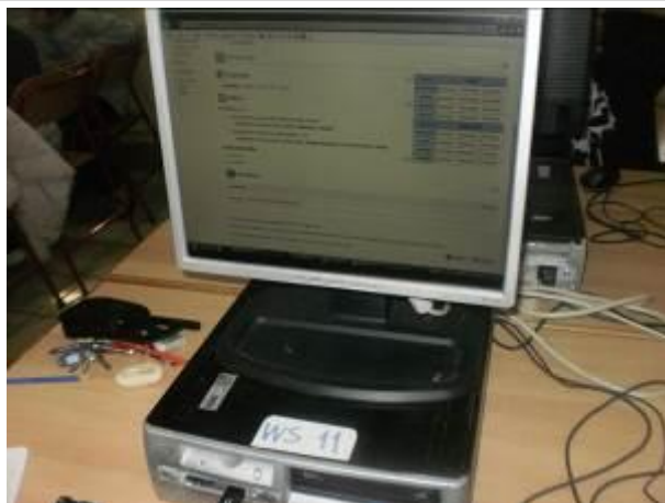
Εικόνα 6: Ετυμολογία λέξεων στο Βικιλεξικό

Στη συνέχεια η εκπαιδευτικός οδήγησε τα παιδιά στις δύο ιστοσελίδες, που είναι η μία λεξικό για τα συνώνυμα και η άλλη λεξικό για τα αντώνυμα . Αφού πλοηγήθηκαν σε όλες τις λέξεις κλήθηκαν να καταγράψουν όποιες λέξεις ήθελαν για να δημιουργήσουν ένα ηλεκτρονικό σταυρόλεξο και για τις δύο περιπτώσεις. Οι λέξεις που τα παιδιά επέλεξαν ήταν: αγορά, βέβαιος, γιαλός, διένεξη, αδέξιος, αθάνατος, γενναίος, δικαίωμα, μάχη. Από αυτές κάποιες χρησιμοποιήθηκαν ως συνώνυμες και κάποιες ως αντίθετες (εικόνα 7).