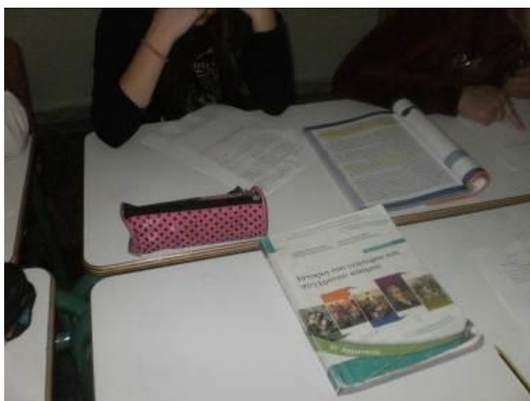
Εικόνες 11 & 12: Τα παιδιά συμπληρώνουν το τελικό φύλλο εργασίας