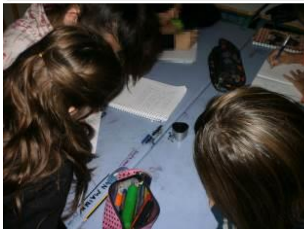
Εικόνες 9 & 10: Τα παιδιά διαμορφώνουν τα κείμενα αφήγησης