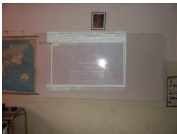
Εικόνα 1: Προβολή του ποιήματος «Κάτω στου Βάλτου τα χωριά»

Στο τέλος του δώρου, ανακοινώθηκε από την εκπαιδευτικό ότι ο σχεδιασμός της γιορτής θα συνεχιστεί στο εργαστήριο πληροφορικής όπου θα δουλέψουν ανά ομάδες με διαφορετικό φύλλο εργασίας η κάθε μία. Στη συνέχεια οι ομάδες, συνεργαζόμενες μεταξύ τους, θα οικοδομήσουν το σχέδιό τους στην ολομέλεια.