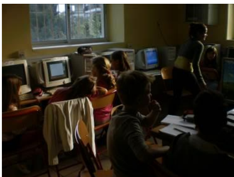
Εικόνα 7: Τα παιδιά της 2ης ομάδας ετοιμάζουν την παρουσίαση