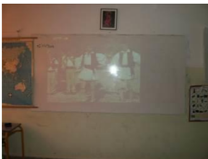
Εικόνα 3: Βίντεο του τραγουδιού «Κάτω στου Βάλτου τα χωριά»