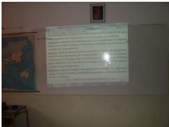
Εικόνα 2: Επεξηγήσεις του ποιήματος