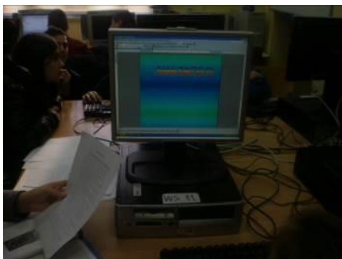
Εικόνα 5: Τα παιδιά της 1ης ομάδας ετοιμάζουν την παρουσίαση

Η πέμπτη ομάδα ακολουθώντας τις οδηγίες (5) της αντέγραψε από το διαδίκτυο τραγούδια και ποιήματα που θα πλαισιώσουν τη σχολική γιορτή (αρχείο: Ποιήματα).