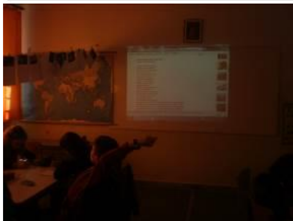
Εικόνα 4: Προβολή του ποιήματος «Λάμπει ο ήλιος στα βουνά»